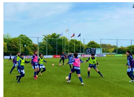
練習風景

また、施設一丸となってチームを応援する機運を高めるためのグッズ提供や、施設への日常的な訪問による「そよ風」利用のお客様と食事やレクリエーションなどを通じた交流のほか、スポーツ選手という専門性を活かした機能訓練プログラムの直接的な実践を行います。