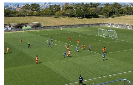
(試合イメージ)

このたびの協業により、「静岡 SSU ボニータ」にとっては、スポーツ選手としての身体づくりのうえで重要となる「栄養問題」が解決することが期待されます。また、地元ファンが大きな資産となるチーム、選手にとっては、若い世代のファンが多い現状から、シニアまでのファン層拡大につながるメリットがあります。