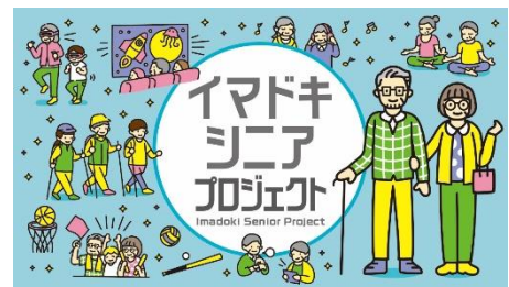
「イマドキシニア」プロジェクト(イメージビジュアル)

ユニマツ RC の示す「イマドキシニア」とは、主に1950年代生まれの高齢者で、高度経済成長期における豊かな生活のなか、テレビなどの娯楽、スポーツなどが身近な存在となり、個性豊かな価値観をもちながら過ごしてきた世代です。同社ではかねて、この「イマドキシニア」に対し、これまでの介護保険サービスに加え、未来社会を見据えた人生・生活背景にフィットする多様性のあるサービスの開発の必要性があると考えています。 https://corp.unimat-rc.co.jp/wp/wp-content/uploads/2021/05/ec5f4fb75f77932b0f8e63e5f42c579e.pdf