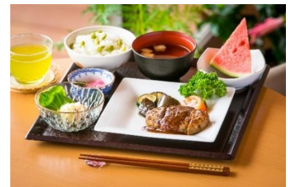
「そよ風」の食事イメージ