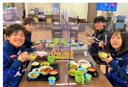
「磐田ケアセンターそよ風」での食事シーン

具体的には、「静岡 SSU ボニータ」のトップ選手 20 名に対し当社が運営するデイサービスとショートステイの複合施設「磐田ケアセンターそよ風 (※2) 」で、当社の管理栄養士が監修を行う、温かくおいしい「そよ風」の食事(夕食)を週に 4 回提供します。