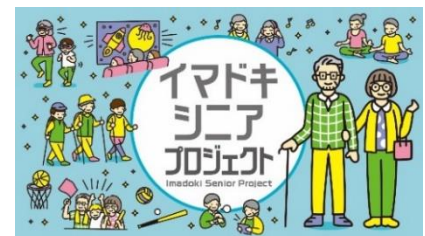
「イマドキシニア」プロジェクト・イメージビジュアル